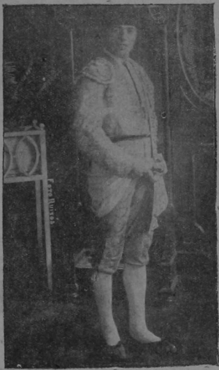
JESUS TRINIDAD (a) LITRI

valiente y arrojado matador de toros, quien celebra hoy su beneficio, quien lo ha puesto bajo los auspicios de los aficionados de la capital. Dadas las simpatías con que cuenta en nuestro público el arrojado diestro, no dudamos que la corrida de esta tarde en el Plaza de Toros será un éxito